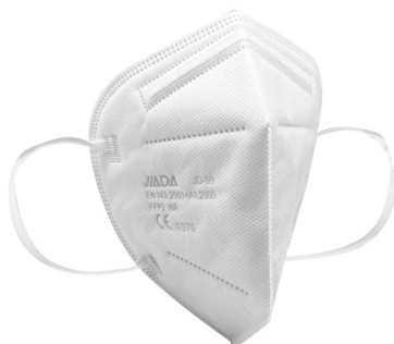
FOTO DEL PRODOTTO